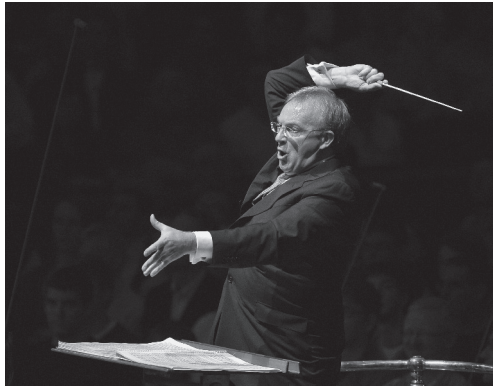
Martyn Brabbins