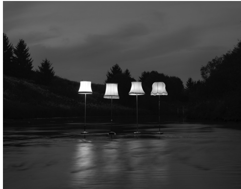
Bach Academie Brugge

vr 27.11.15 / 20.00 / Concertzaal deFilharmonie & Brussels Jazz Orchestra / Dansmuziek tussen klassiek en jazz Nobel, sentimenteel, meeslepend, maar ook onontkoombaar en noodlottig: de wals als allegorie voor het moderne tijdperk. Ravels nobele, sentimentele walsen lijken op elk moment te kunnen doorslaan in een niet te stoppen draaikolk: glanzend aan de buitenkant, een gapend graf aan de binnenkant.