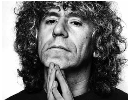
Steven Isserlis

do 30.04.15 / 20.00 / Concertzaal Brussels Philharmonic / De orkestmachine De technologische vernieuwingen, de verse wonden van of de vlucht voor de oorlog: inspiratie te over voor componisten tijdens de naoorlogse jaren. Zo is Prokofievs Tweede symfonie een ode aan het industriële tijdperk, wordt Varèse geprikkeld door zijn nieuwe thuisstad New York en componeert Ravel een pianoconcerto voor linkerhand, opgedragen aan de tijdens de oorlog verminkte Paul Wittgenstein.