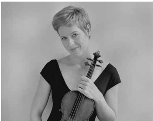
Isabelle Faust