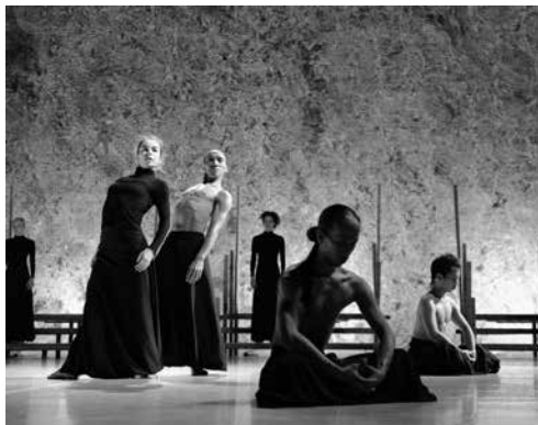
Ghost Track

za 13.12.14 / 20.00 / Concertzaal Ghost Track / LeineRoebana (Nederland/Indonesië) i.h.k.v. December Dance 14 in samenwerking met Cultuurcentrum Brugge