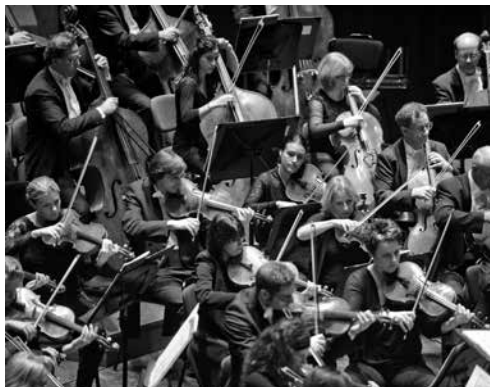
Rotterdams Philharmonisch Orkest

Het is maar een kleine stap van barokke baslijnen naar aanstekelijke jazz-improvisaties. Eentje die L'Arpeggiata al jaren met overtuiging en verve weet te zetten. In haar gloednieuwe programma infiltreert Christina Pluhar met haar gasten de wereld van Henry Purcell. Verwacht u aan Purcells grootste hits in een onverwachts hedendaags jasje.