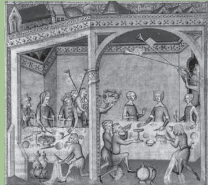
Feestelijk tafereel uit Remède de fortune , door Guillaume de Machaut