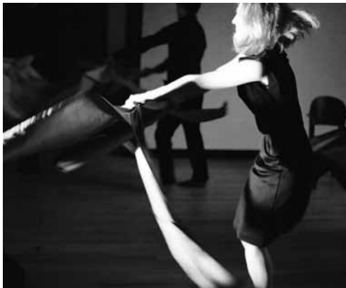
Waar is mijn ziel?

wo 13.04.2011 / 20.00 / Concertzaal Waar is mijn ziel? / B'Rock & Muziektheater Transparant. Monteverdi Caroline Petrick ontrafelde de madrigalen van Monteverdi en maakt een voorstelling over verlangen, dood en macht. Het barok-orkest B'Rock interpreteert samen met enkele voortreffelijke solisten deze nieuwe, eigenzinnige montage. Madrigalen als stillezens van de ziel.