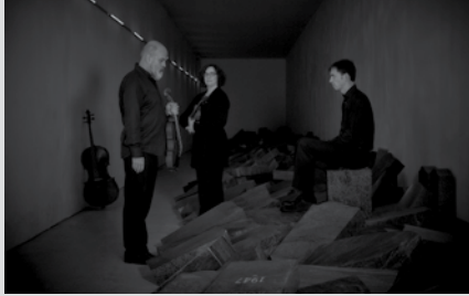
@ Hans Morren