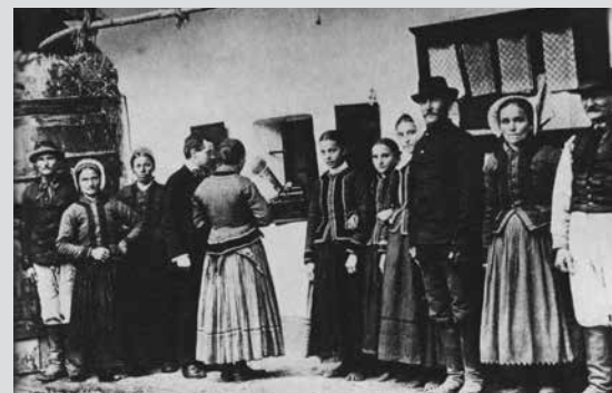
Béla Bartók neemt volksmuziek op in 1908.

Die kruisbestuiving heeft er ook voor gezorgd dat volksmuziek in zeer verschillende gradaties en vormen in het repertoire voorkomt. De eenvoudigste manier is die waarbij de volksmelodieën (nagenoeg) letterlijk behouden blijven maar verbonden wordt met begeleidingen die méér doen dan alleen maar de meest voor de hand liggende harmonieën spelen. In dergelijke werken worden de melodieën als het ware van onderuit verrijkt. Ze krijgen een extra leven doordat de begeleidende partijen de vanzelfsprekendheid overstijgen. Dat is wat er gebeurt in bijvoorbeeld de Hongaarse volksliederen van Zoltán Kodály. Dat zijn stuk voor stuk melodieën die tot het Hongaarse collectieve geheugen behoren, maar die een meerwaarde krijgen dankzij de vindingrijkheid van Kodály's pianopartijen. De liederen zijn meestal heel erg kort, maar slagen er toch in om heel snel een diepe en mysterieuze sfeer op te roepen. De volslagen onbekendheid van de Hongaarse taal in West-Europa maakt dat mysterie bij ons alleen nog maar groter.