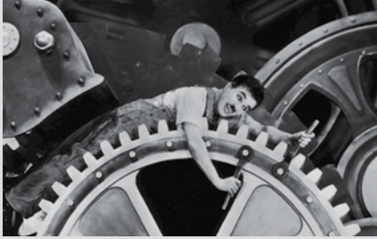
Modern Times