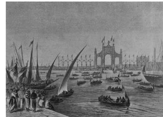
De opening van het Suezkanaal

Het New Yorkse Vrijheidsbeeld, gebouwd door Eiffel en betaald door Frankrijk, werd op 28 oktober 1886 onthuld en werd een symbool van hoop voor miljoenen Europese migranten. De vele wetenschappelijke