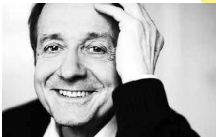
Miklós Perényi