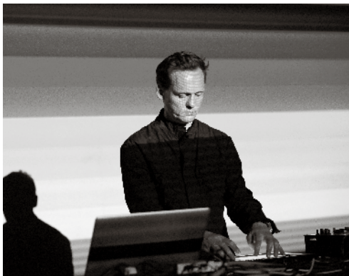
Alva Noto

do 13.04.17 / 20.00 / Concertgebouw Alva Noto – Yves De Mey – Mathieu Serruys / UNIEQAV