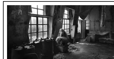
HENK VAN RENSBERGEN wo 25.01.17 — zo 16.04.17

Fotograaf Henk van Rensbergen is al meer dan dertig jaar gefascineerd door de magie en spanning van leegstaande fabrieken en vergeten kasteeltjes. Sinds 2015 werkt hij aan een nieuw project met beelden van hoe de wereld er zou kunnen uitzien als de mens zou uitsterven. Een selectie van zijn foto's is momenteel te bewonderen in het Concertgebouwcafé.