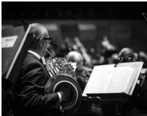
Rotterdams Philharmonisch Orkest