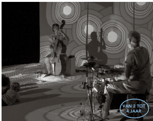
Glimp © Ronald Knapp

za 04.11.2017 / 10.00, 11.30 & 16.00 / Studio 1 Glimp / Oorkaan