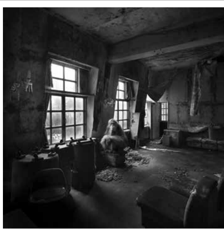
HENK VAN RENSBERGEN wo 25.01.17 — zo 16.04.17

Fotograaf Henk van Rensbergen is al meer dan dertig jaar gefascineerd door de magie en spanning van leegstaande fabrieken en vergeten kasteeltjes. Sinds 2015 werkt hij aan een nieuw project met beelden van hoe de wereld er zou kunnen uitzien als de mens zou uitsterven. Een selectie van zijn foto's is momenteel te bewonderen in het Concertgebouwcafé.