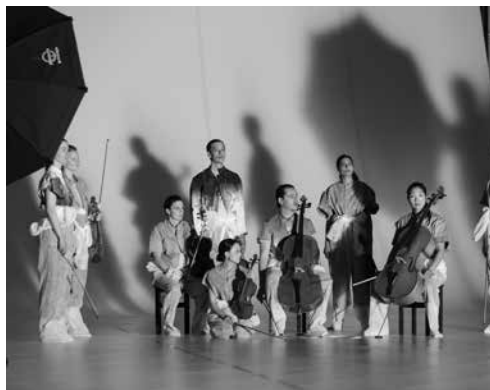
Solistenensemble Kaleidoskop

vr 10.03.17 / 20.00 / Concertzaal scène Pianola, satire de trash / ChampdAction Pianola, satire de trash neemt de tumultueuze periode van het futurisme onder de loep met de pianola als leidraad. De machine, zoals het weefgetouw en de daaruit afgeleide pianola, moest de mens bevrijden en hem tijd geven voor zijn intellectuele en creatieve ontplooiing. Vandaag maken we met de opkomst van de robots een gelijkaardige ontwikkeling mee.