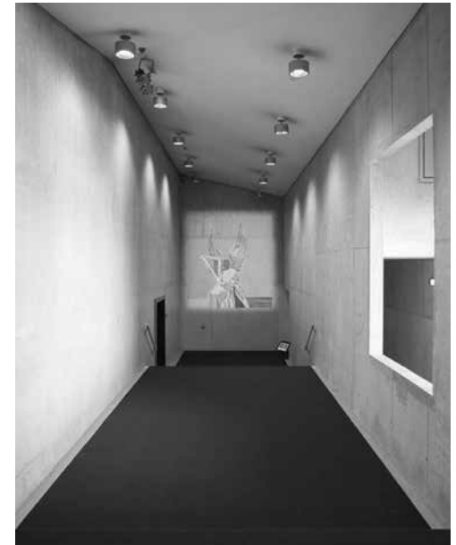
Angel van Luc Tuymans

Luc Tuymans is een van de belangrijkste Europese schilders van zijn generatie. Zijn werk wordt sterk beïnvloed door fotografie, televisie en schilderkunst. Hij schuwt politiek beladen onderwerpen en referenties naar een onverwerkt verleden niet.