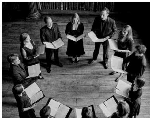
Stile Antico

vr 17.03.17 / 20.00 / Concertzaal Solistenensemble Kaleidoskop & Luigi De Angelis / змея – The Riot of Seduction De visionaire kunstvernieuwer Sergey Diaghilev – de geniale generaal van de kunst – diende als inspiratiebron voor de muziektheatervoorstelling змея . Deze nieuwe voorstelling van Solistenensemble Kaleidoskop en Luigi De Angelis begint als een installatie, maar transformeert in een grillig, zinnenprikkelend en uitdagend spektakel.