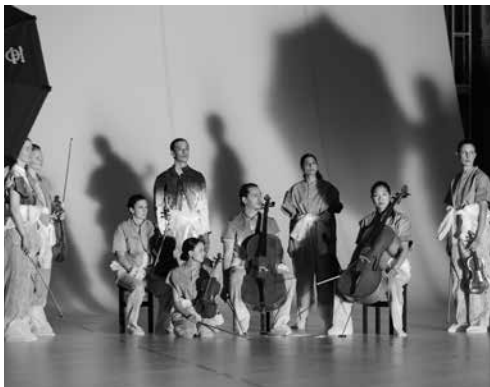
Solistenensemble Kaleidoskop

vr 17.03.17 / 20.00 / Concertzaal Solistenensemble Kaleidoskop & Luigi De Angelis / змея – The Riot of Seduction De visionaire kunstvernieuwer Sergey Diaghilev – de geniale generaal van de kunst – diende als inspiratiebron voor de muziektheatervoorstelling змея . Deze nieuwe voorstelling van Solistenensemble Kaleidoskop en Luigi De Angelis begint als een installatie, maar transformeert in een grillig, zinnenprikkelend en uitdagend spektakel.