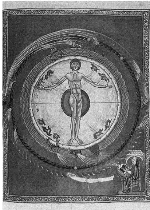
Het derde visioen van Hildegard von Bingen