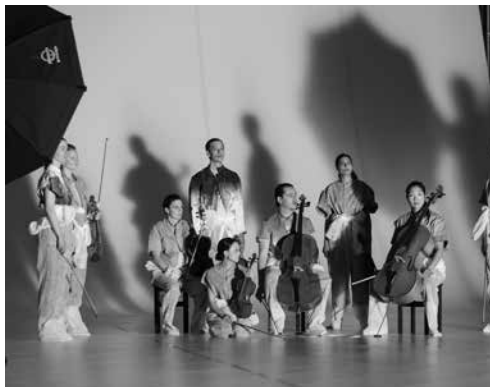
Solistenensemble Kaleidoskop