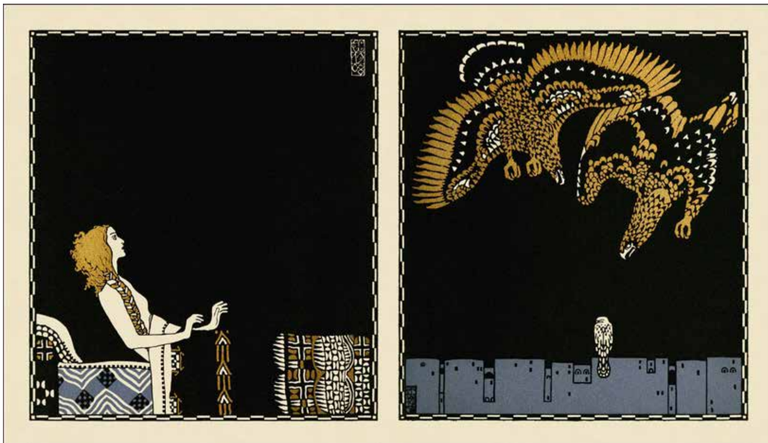
Carl Otto Czeschka, Die Nibelungen (1920)

In de muziek van de vroegbarok en zeker bij het ontstaan van de eerste opera's, kreeg de aloude vertelkunst nieuw leven ingeblazen. Nadat men in de renaissance