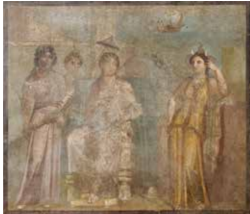
Dido op haar troon, Napels (1e eeuw)