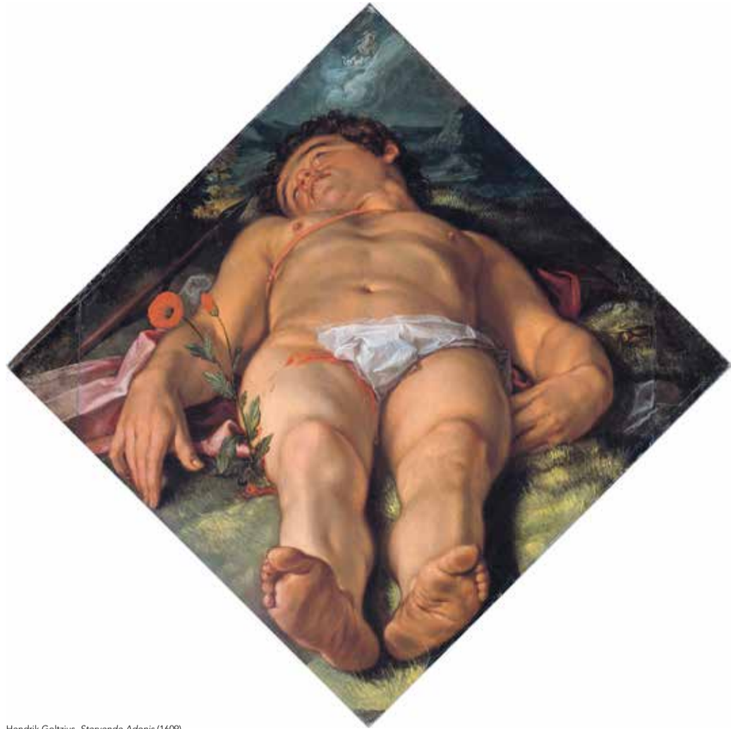
Hendrik Goltzius, Stervende Adonis (1609)

Maar ook wanneer mensen elkaar de lange, heilige verhalen wilden vertellen over de geschiedenis van hun volk, verhief men de stem. In de strip Asterix ziet men de kwelende bard Assurancetourix en zijn harp niet graag komen, maar in werkelijkheid speelden deze dichters zangers een uiterst belangrijke rol. In culturen zonder schrift waren zij immers het wandelende geheugen van