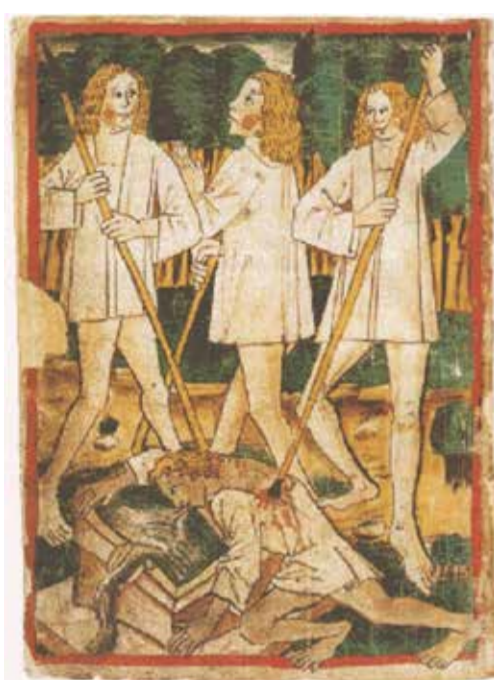
De moord op Siegfried, Nibelungenlied handschrift K (ca. 1480-90)

de zingende stem had losgemaakt van haar boodschap en ten dienste gesteld van de abstracte schoonheid van een polyfoon stemmenweefsel, wilde men de stem opnieuw haar vertellende kracht teruggeven. De stem moest net als in de oude Griekse tragedies de emoties van een verhaal tot in de kleinste nuances weergeven.