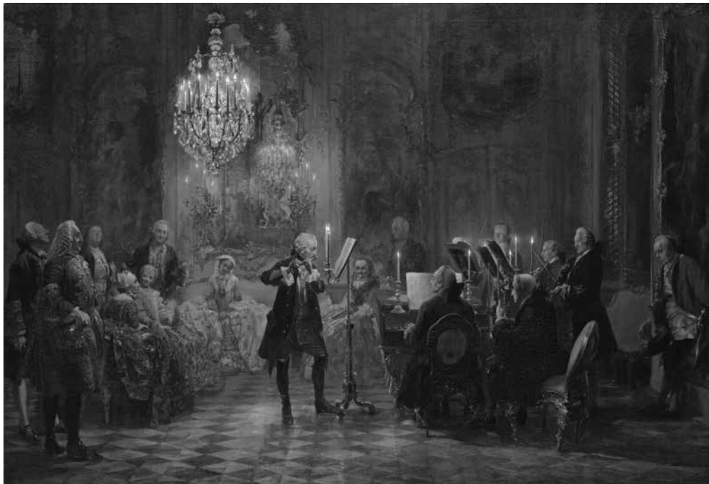
Adolph Menzel: Concert in Sanssouci (1850-52)

Op de technische grondvesten van de voorbije barok konden componisten in vele stijlen bouwen. Toch zijn er belangrijke hoofdlijnen te bemerken. Een eerste is de emancipatie van de instrumentale muziek. De barok was in wezen de kunst van de Contrareformatie, haar hoofddoel was 'de ziel van de gelovige in vuur te zetten' en hen 'op aarde een voorafbeelding van de hemel te bezorgen'. Dat kon alleen met tekst en om die reden werd niet-vocale muziek vaak omschreven als 'lauter Rausch'. In zijn