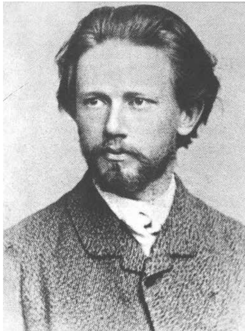
Pyotr Ilyich Tchaikovsky