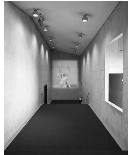
Angel van Luc Tuymans

Luc Tuymans is een van de belangrijkste Europese schilders van zijn generatie. Zijn werk wordt sterk beïnvloed door de fotografie, televisie en schilderkunst. Hij schuwt politiek beladen onderwerpen en referenties naar een onverwerkt verleden niet.