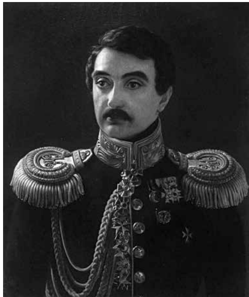
Aleksey Fyodorovich L'vov (1798-1870)