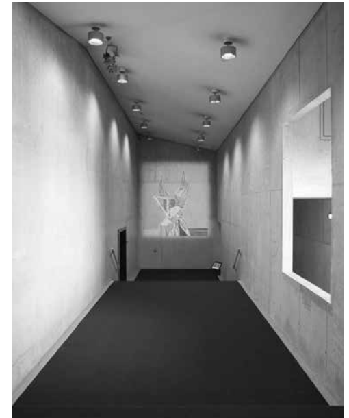
Angel van Luc Tuymans

Luc Tuymans is een van de belangrijkste Europese schilders van zijn generatie. Zijn werk wordt sterk beïnvloed door de fotografie, televisie en schilderkunst. Hij schuwt politiek beladen onderwerpen en referenties naar een onverwerkt verleden niet.