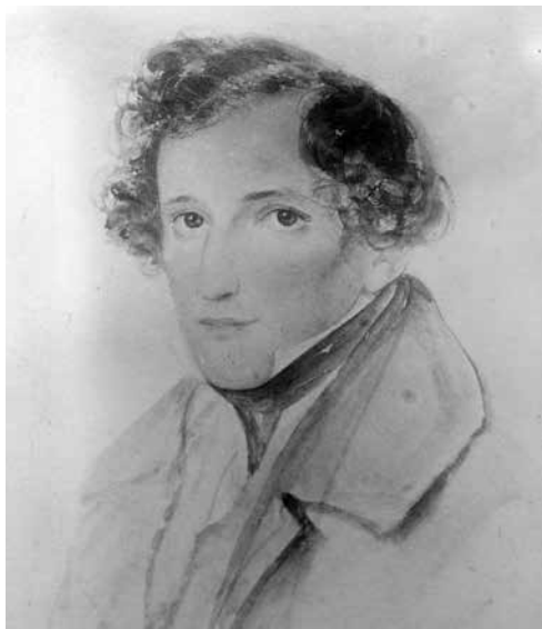
August Grahl's miniatuurportret van Mendelssohn op ivoor (1860)

Felix Mendelssohn (1809-1847) Prelude en fuga nr. 4 in As , opus 35 (1835-37) Prelude en fuga nr. 1 in e , opus 35 (1832-37) Variations sérieuses in d , opus 54 (1841)