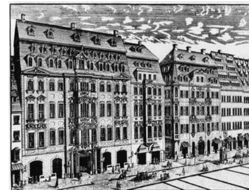
De Leipziger Katherinenstrasse met Café Zimmermann in het middelste, smalle gebouw (ca. 1720)