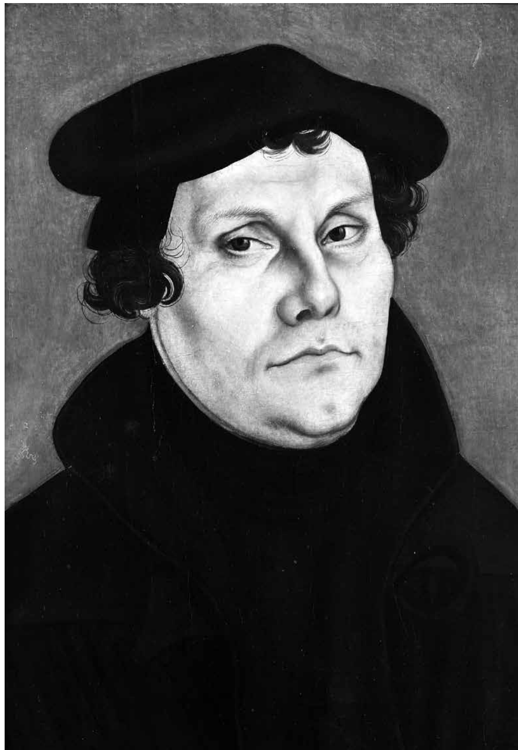
Lucas Cranach, Martin Luther (1528)

Steve Reich schreef zijn New York Counterpoint op vraag van klarinettist Richard Stolzman als tweede van zijn Counterpoint -drieluik; tegelijk maakte hij een versie voor het Vienna Saxophone Quartet. Het vergt de nodige voorbereiding, want de meeste van de elf genoteerde stemmen moeten vooraf worden opgenomen. We horen de vroege Reich van Piano Phase , Violin Phase en Music for 18 Musicians , maar de veranderingen binnen de in elkaar grijpende motieven gaan in een sneller tempo. In het derde deel van het werk stopt de verandering echter in de bovenstemmen, terwijl de baskant nu vol in de schijnwerpers komt.