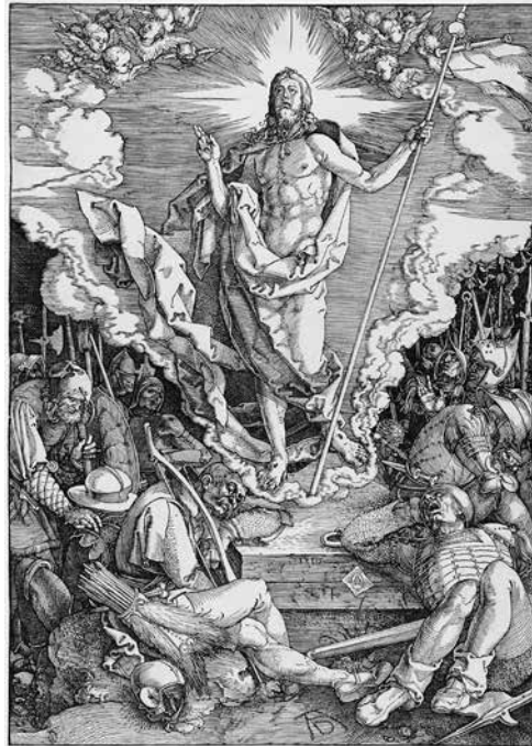
Albrecht Dürer, Opstanding van Christus (1510)

Dieterich Buxtehude (ca.1637-1707) Herzlich lieb hab ich dich, o Herr