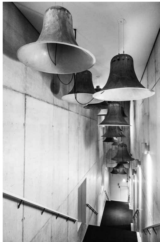
Annunciation , Pavel Bůchler

Ontdek de kunstcollectie van het Concertgebouw