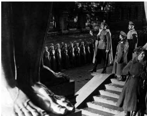
Still uit Oktober

za 18.03.17 / 20.00 / Concertzaal Brussels Philharmonic / Eisensteins cultfilm Oktober Oktober (1928) is Sergej Eisensteins monumentale eerbetoon aan de Oktoberrevolutie, de 'tien dagen die de wereld deden wankelen'. Brussels Philharmonic zorgt voor de muziek met een speciaal voor deze film voorziene score, samengesteld door Russische-muziekexpert Francis Maes.