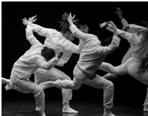
Hofesh Shechter

in samenwerking met Cultuurcentrum Brugge