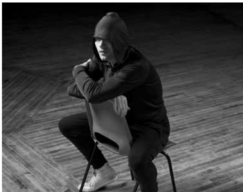
Michael Clark

za 03.12.16 / 20.00 / Concertzaal to a simple, rock 'n' roll . . . song. / Michael Clark Company