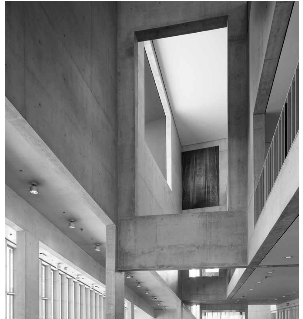
H.S.-N.Y.-94-99 van Dirk Braeckman

Concertgebouw Brugge verleent onderdak aan een interessante verzameling actuele kunst, die gestaag aangroeit. Voor deze collectie wordt nauw samengewerkt met architect Paul Robbrecht, die samen met de kunstenaars kiest voor werken die in de moderne architectuur zelf geïntegreerd kunnen worden.