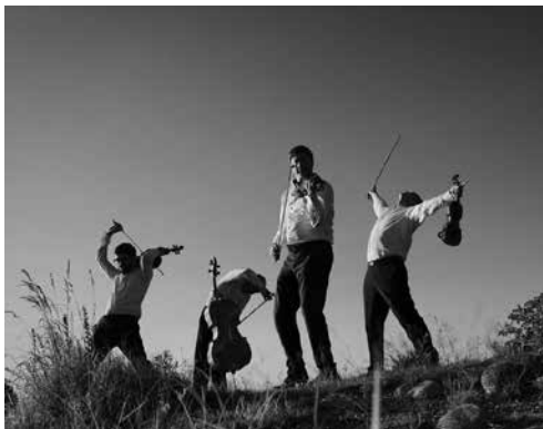
Danel Kwartet

vr 30.09.16 / 20.00 / Kamermuziekzaal Danel Kwartet / Het Russische strijkkwartet I Het Danel Kwartet bijt zich al jaren vast in de strijkkwartetten van Shostakovich en Weinberg en excelleert ondertussen in deze universele en tijdloze muziek. In de strijkkwartetten van beide componisten weerklinkt zowel de dreiging die uitging van het Sovjet-regime en het verdriet om zinloos vermoorde geliefden, als de strijd tegen onrecht, en de hoop op een betere wereld.