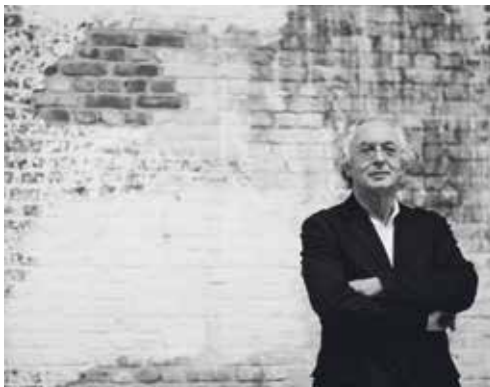
Philippe Herreweghe