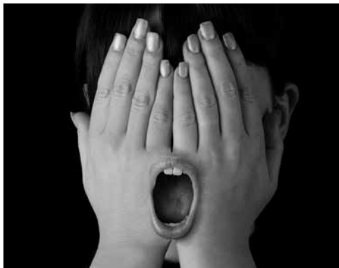
Freedom o(r) Speech

De blinde dichter reist doorheen de geschiedenis via de stambomen van alle Needcompany-leden. En stelt vast dat iedereen met iedereen ergens een verband of overeenkomst heeft. De blinde dichter gaat over sterke vrouwen die met stenen gooien en op de brandstapel terechtkomen. En over een kruisvaarder met een te klein harnas. Een aanstekelijke mix van theater, dans, muziek en performance!