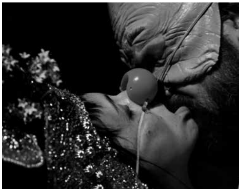
De blinde dichter

do 29.09.16 / 20.00 / Concertzaal De blinde dichter / Jan Lauwers & Needcompany