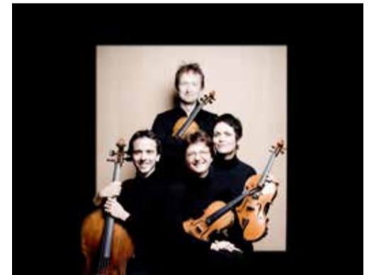
Arcanto Quartett

za 30.04.16 / 20.00 / Concertzaal BLINDMAN [sax] & Collegium Vocale Gent / Morgen! Sensuele liefdeslyriek lost op in devote Maria-aanbidding, stemmen verstrengelen zich met doorleefd koper, partikels van elektronisch ontlede klanken verdwijnen in de mystieke ruimte. Eric Sleichim ging op zoek naar het spanningsveld tussen schijnbaar uiteenlopende muzikale werelden: de renaissance en de 21e eeuw.