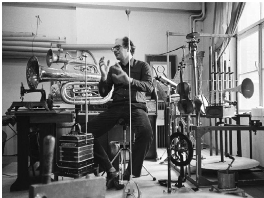
Mauricio Kagel (1973) © Zoltan Nagy