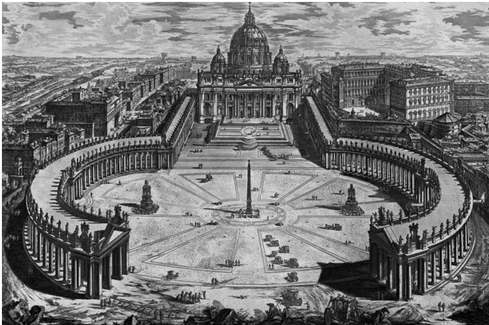
Giovanni Battista Piranesi, Zicht op de Sint-Pietersbasiliek, Rome (1748)

De 'stile moderno', die in Italië omstreeks 1600 opgang maakte, vond in de Nederlanden pas laat ingang. Tot de eerste proeven behoort een aantal motetten van Jan Baptist Verrijt, die in 1649 in Antwerpen werden uitgegeven. Deze Nederlandse componist was gedurende enkele jaren organist in Leuven (1636-1639). Salve mi Jesu , een gebed tot de gekruisigde Christus, is een motet voor drie solisten en