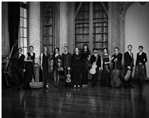
Holland Baroque

vr 30.10.15 / 20.00 / Concertzaal Cappella Mediterranea / Amore Siciliano 'Bella donna crudel ... viva la morte!' Aan passie schort het niet op het Sicilië van Leonardo García Alarcón. Verrukkelijke volksliederen, die perfect smaken naast verleidelijke liefdesmadrigalen van barokke Italianen als Scarlatti en D'India en de zelden gehoorde Siciliaan Cataldo Amodei. Oude muziek op z'n levendigst!