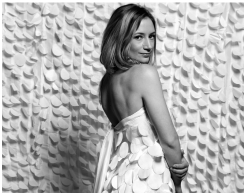
Sabine Devieille © Marc Ribes

za 14.11.15 / 20.00 / Concertzaal Private View / Muziektheater Transparant Componiste Annelies Van Parys had voor haar eerste opera twee thema's voor ogen: voyeurisme en sociale isolatie. Private View speelt zich af binnen de besloten wereld van een flatgebouw. Met footage uit oude films stuwt het videocollectief het verhaal op ambigue wijze voort niets is eenduidig waar of onwaar, alles blijft voor interpretatie vatbaar.