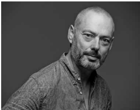
Mark Padmore