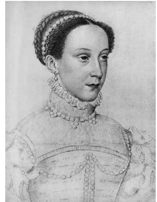
Maria Stuart, tekening naar het Clouet-portret