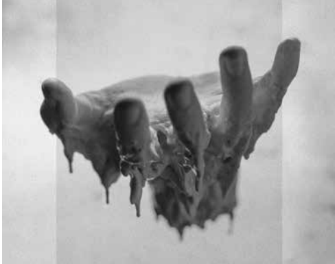
Weighing Of The Heart