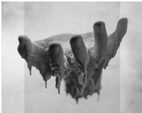
Weighing Of The Heart

De muzikanten katapulteren de luisteraar zo in de meest verscheiden muzikale ruimten en werelden.