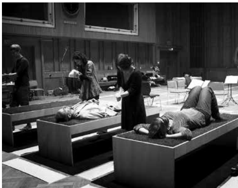
Dark Was The Night