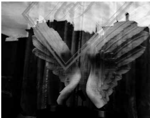
Eric Montes, from the series Romance , 2008