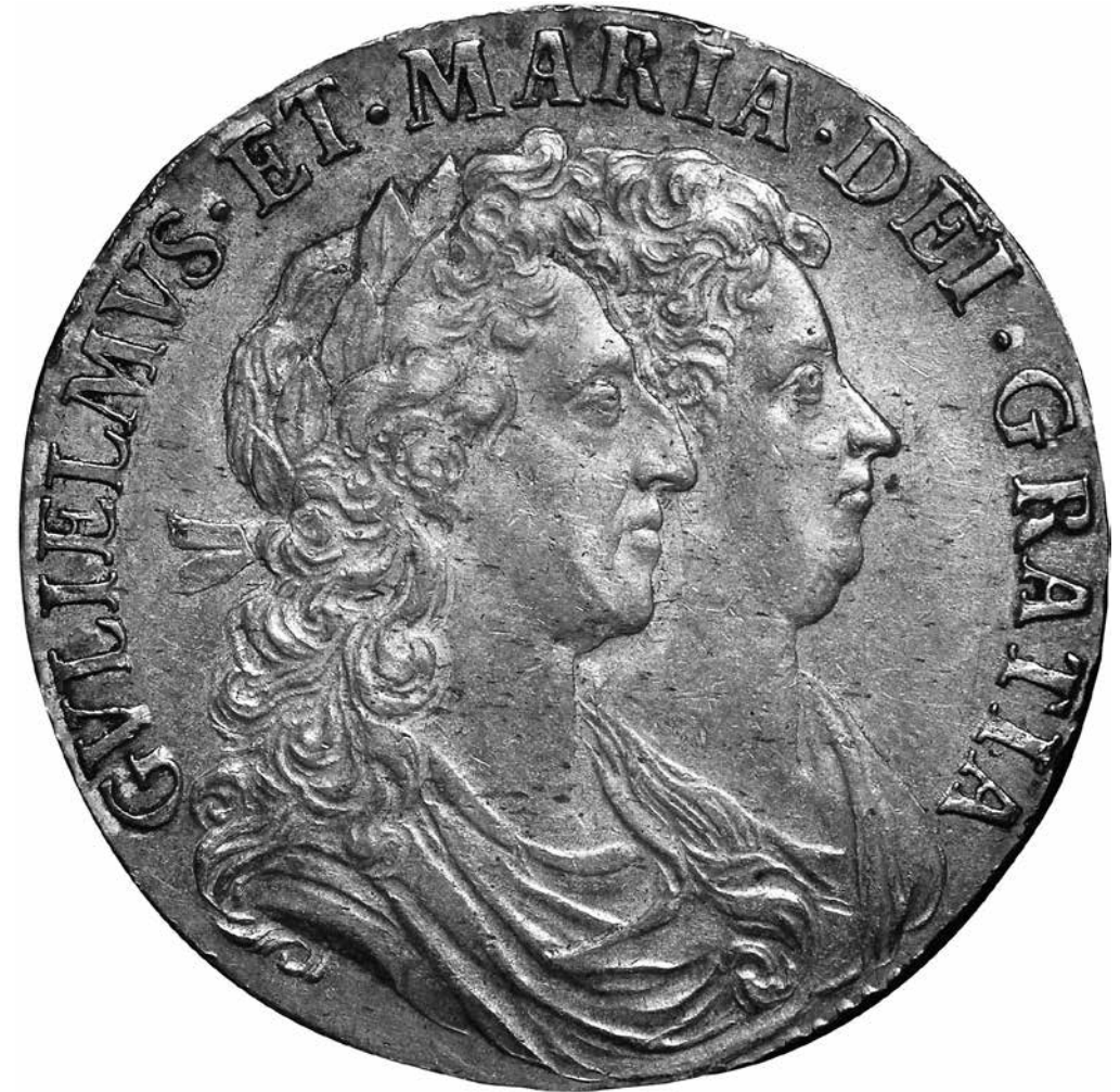
Munt met Willem III en Mary Stuart