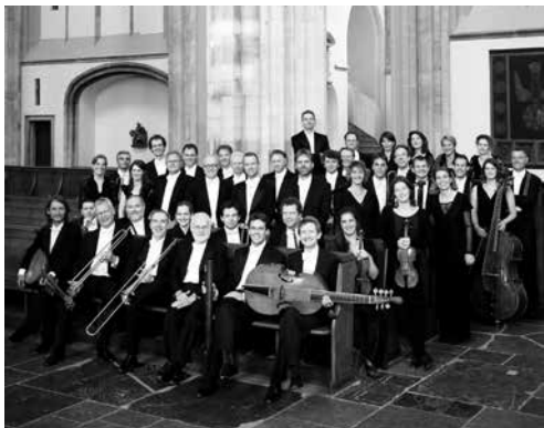
Amsterdam Baroque Orchestra & Choir

vr 19.12.14 / 20.00 / Concertzaal Amsterdam Baroque Orchestra & Choir / Bach. Weihnachtsoratorium Geen mooiere opstap naar kerst dan Bachs feestelijke Weihnachtsoratorium . Bach, op het toppunt van zijn artistieke kunnen, putte voor dit werk uit zijn hele oeuvre en onttrok zo enkele van zijn allermooiste melodieën aan de vergetelheid. Ton Koopman kijkt als geen ander recht in de ziel van de grootmeester.