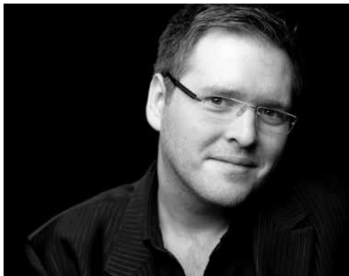
Bart Naessens

wo 17.12.14 / 20.00 / Kamermuziekzaal Les Abbagliati / Aliens in London Tegen het einde van de 17e eeuw werd Londen het muzikale centrum van Europa. Les Abbagliati bieden een snapshot van de muziek en artiesten die rond 1700 razend populair waren, van de Duitser Händel, de Italianen Bononcini en Astorga tot de Fransman Leclair. Uniek: door een reconstructie van de barokke gestic krijgen de cantates extra diepte.