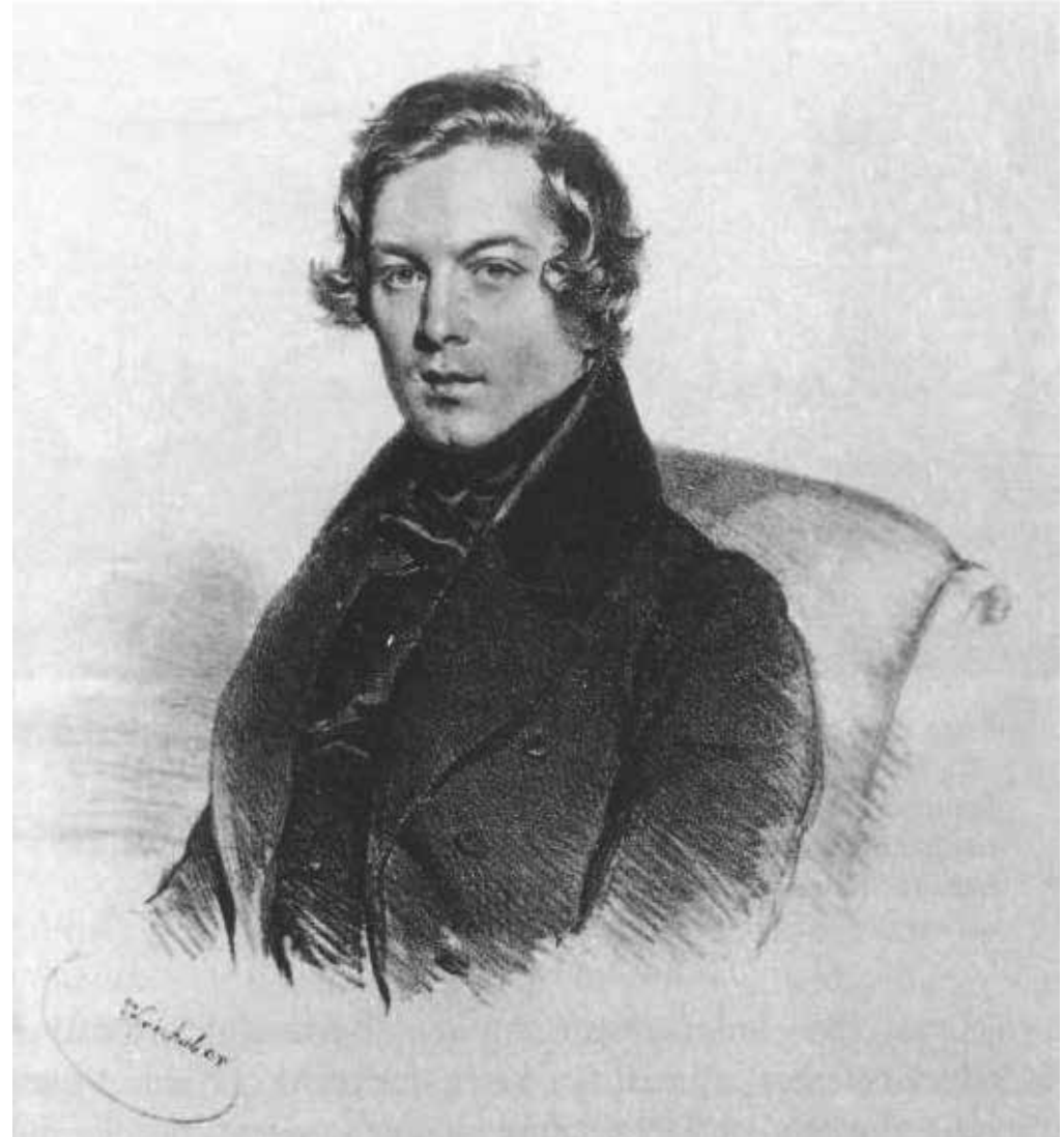
Robert Schumann, litho van Joseph Kriehuber, 1839