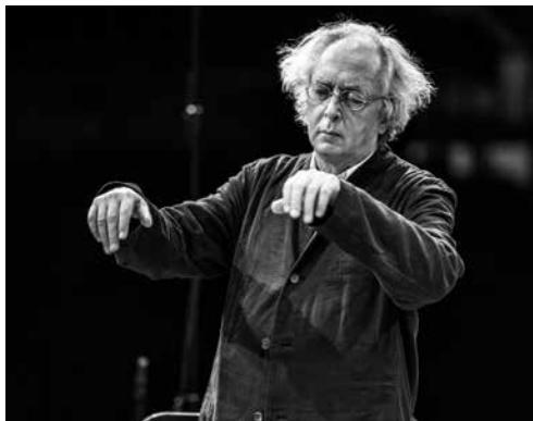
Philippe Herreweghe

wo 17.12.14 / 20.00 / Kamermuziekzaal Les Abbagliati / Aliens in London Tegen het einde van de 17e eeuw werd Londen het muzikale centrum van Europa. Les Abbagliati bieden een snapshot van de muziek en artiesten die rond 1700 razend populair waren, van de Duitser Händel, de Italianen Bononcini en Astorga tot de Fransman Leclair. Uniek: door een reconstructie van de barokke gestiek krijgen de cantates extra diepte.