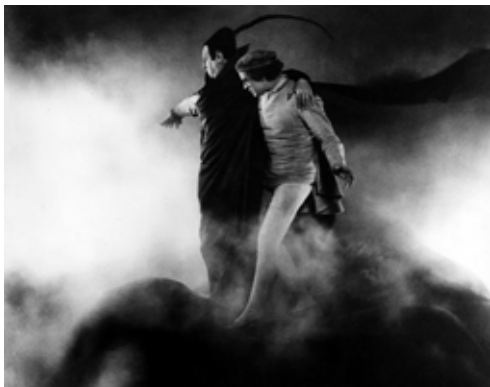
Faust. Eine deutsche Volkssage, F.W. Murnau (1926)