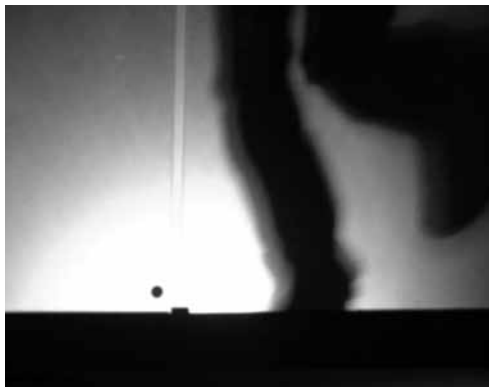
P.A.R.T.S. Graduation Tour

La La La Human Steps viert met Creatie 2011 zijn dertigjarige bestaan. Choreograaf Édouard Lock baseert zich voor dit stuk op twee barokopera's: Dido and Aeneas van Henry Purcell en Orphée et Eurydice van Gluck. Lock vroeg componist Gavin Bryars om muzikaal commentaar te leveren op deze twee werken.