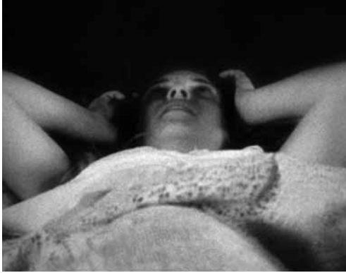
Pelléas et Mélisande © Héctor Cruz