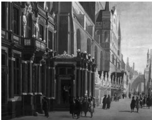
Sint-Donaas, 1696. Detail van een schilderij van Jan Baptist van Meunincxhove.

za 21.04.12 - zo 22.04.12 / Concertgebouw CLEMENS 500