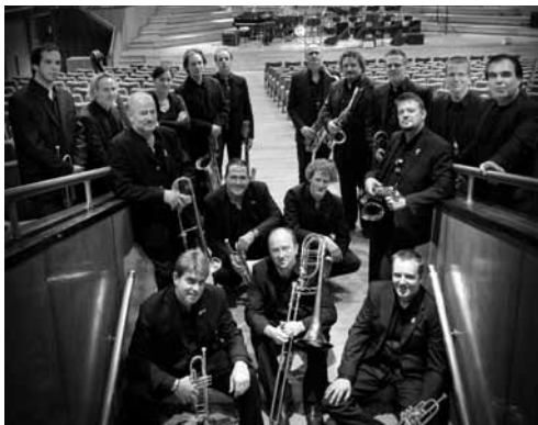
Brussels Jazz Orchestra