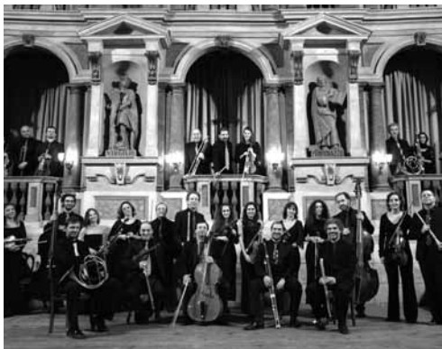
Ensemble Zefiro