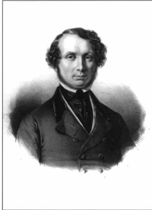
Hans Christian Lumbye