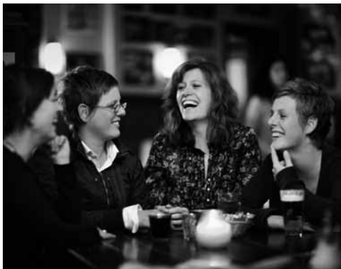
Holland Baroque Society