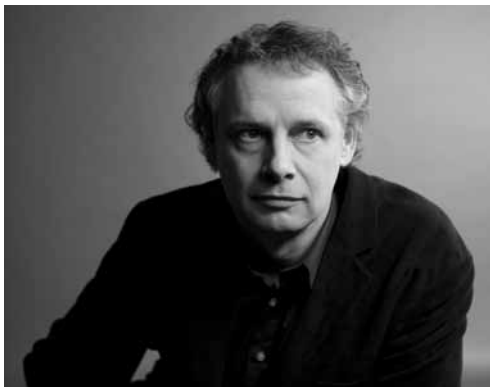
Pieter Wispelwey