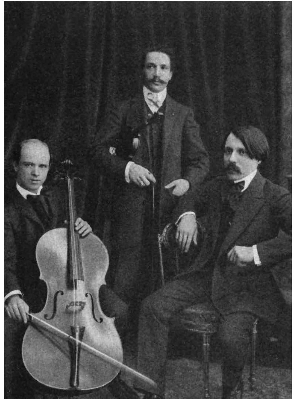
Het trio Cortot-Thibaud-Casals: Pablo Casals, Jacques Thibaud, Alfred Cortot